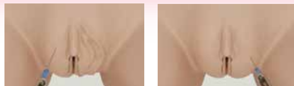
VULLEN BUITENSTE SCHAAMLIPPEN REBIRTH SKINTECH

If you don't like how things are, change them! Make yourself HAPPY